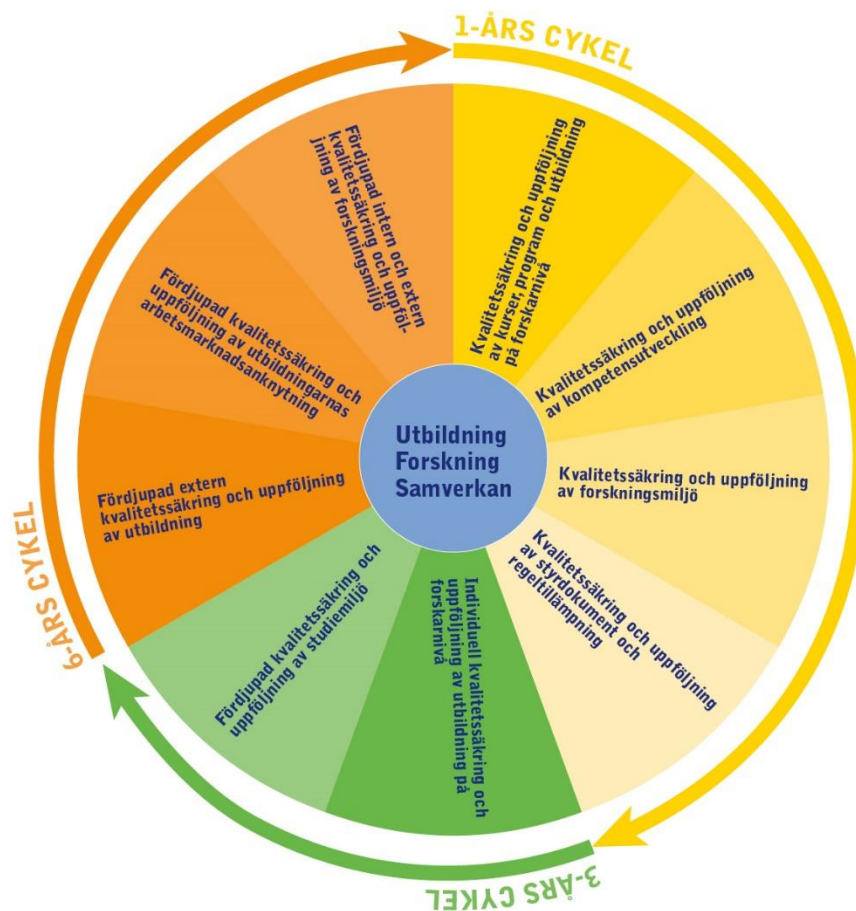
Figur 3 Systemets struktur kring 1, 3 och 6-årscykler

Inom respektive huvudområde struktureras och beskrivs aktiviteterna närmare avseende periodicitet, ansvar och styrdokument. Implicit i detta ligger utvecklingscykelns fyra faser: (1) genomföra, (2) undersöka, följa upp och utvärdera, (3) analysera samt (4) planera och återkoppla.